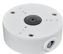
3000/141 Scatola di giunzione