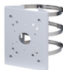
3000/147 Adattatore da palo

Le specifiche tecniche sono soggette a variazioni senza preavviso.